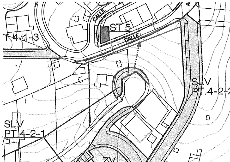
Gráfico 3 . Del plano 7.4 "Ordenación"