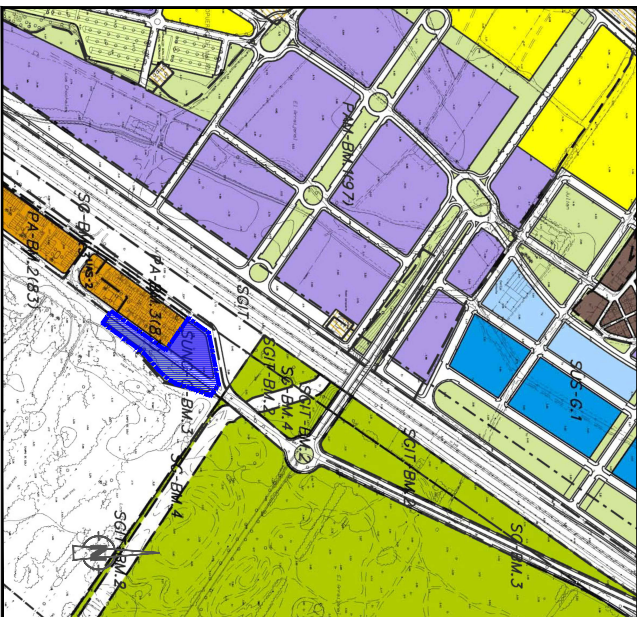
SITUACIÓN EN EL PGOU DE MÁLAGA ESCALA 1/5.000