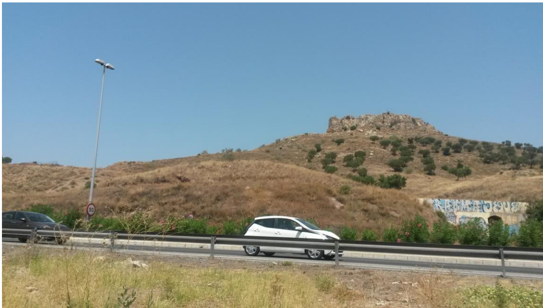
Imágenes de la franja sur del Cerro Coronado

La presente Modificación de Elementos del PGOU a los efectos de dar cumplimiento a la Ejecución de Sentencia nº 180/15 del TSJA en Málaga, consiste en la nueva clasificación de los suelos del Cerro Coronado de esta ciudad, en la franja colindante con el suelo urbano, que no tuvo en el POTAUM vigente la consideración de Zona de Protección Territorial como el resto del citado monte, como Área de Sensibilidad Paisajística, dentro de la categoría que el vigente PGOU define como Suelo No Urbanizable de Especial Protección por Planificación Territorial y Urbanística, Zona de Protección Urbanística del PGOU. Esta sentencia habida en el RCA 453/11, considera que el POTAUM no protege dicho suelo, en contra de la apreciación del PGOU, que consideró extendida dicha protección a dicha estrecha franja, en blanco en el POTAUM, por entender que la misma se debía a un resguardo en el dibujo de estas zonas colindantes al suelo urbano, por la pequeña escala de su edición.