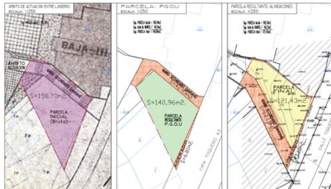
Fig. 3: Comparativa Parcela PGOU y parcela resultante propuesta.

El Estudio de Detalle propone reubicar el viario previsto sobre la parcela sita en calle Toquero nº 43 según el planeamiento de desarrollo, el PERI C.7 "Olletas" pasándolo de la linde norte a la linde sur de la misma para, a continuación, ordenar los volúmenes que resultarían de aplicar la ordenanza CTP-2 sobre la parcela resultante. Esto permite a su vez dar cumplimiento a la sentencia explicada en el punto 2.4 del informe de AI y que obliga a respetar 3 m. de distancia desde la vivienda de la linde suroeste de la parcela.