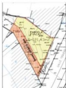
Cesión del Estudio de Detalle

En el informe técnico del E.D. se indica: "Con respecto a las cesiones que propone el documento, éstas suponen una superficie de 61,17 m 2 s para viario secundario y 7,10 m 2 que se suman al acerado existente, lo que supone un total de 69,27 m 2 s." Cabe señalar que existe un error material, ya que la suma de ambas superficies es de 68,27 m 2 s.