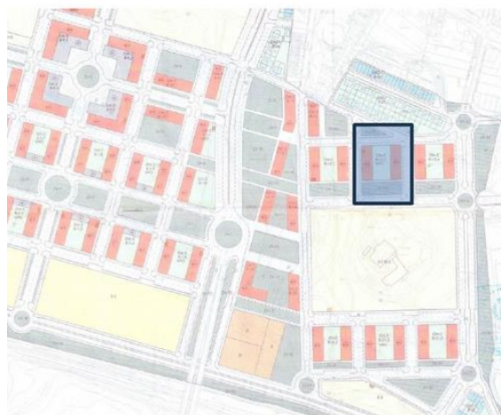
Situación de parcela R 15.3 en el Sector