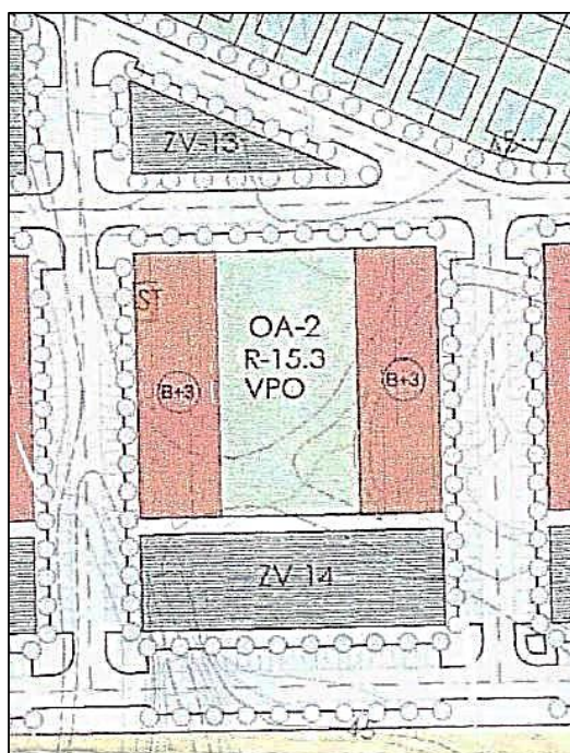
Plan Sectorización: Área de Movimiento y Zona Verde Privada.